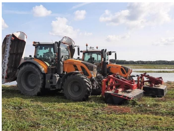
Een voorbeeld van een maaimachine

In een eerdere nieuwsbrief van maart vertelden we al hoe we deze maaiwerkzaamheden uitvoeren. We maaien met speciale front- en zijmaaiers. Om ervoor te zorgen dat dieren veilig blijven, gebruiken we een wildredder. Dit is een ijzeren constructie voorop de maaier met kettingen die de dieren wegjaagt voordat de maaier langs komt. Dankzij de wildredder kunnen we de meeste dieren op tijd verjagen en zo de biodiversiteit in het gebied beschermen.