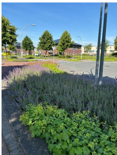
De bloei op verschillende rotondes

In eerdere nieuwsbrieven vertelden we over de nieuwe aanplantingen op diverse rotondes en in parken, waaronder het Kings Park. Inmiddels, enkele weken later, zijn deze planten prachtig gegroeid en staan ze volop in bloei. Dit geeft Oosterheem in de lente en zomer een stralend uiterlijk. Daarnaast zijn we druk bezig om alle hagen netjes bij te werken. Als we door Oosterheem wandelen, krijgen we echt een zonnig gevoel. Hieronder delen we een paar schitterende foto's!