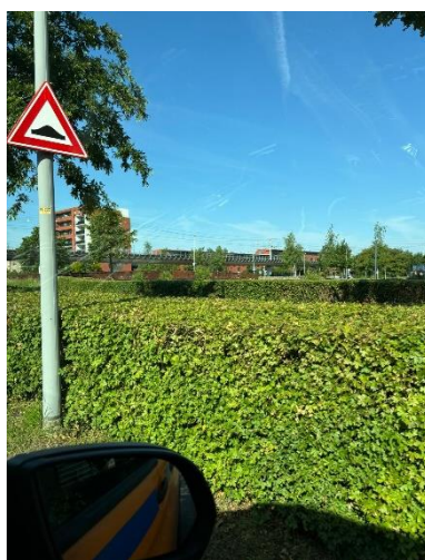
Strakke hagen op verschillende plekken in Zoetermeer